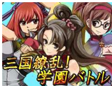
【TOP ページ:イメージ画像】